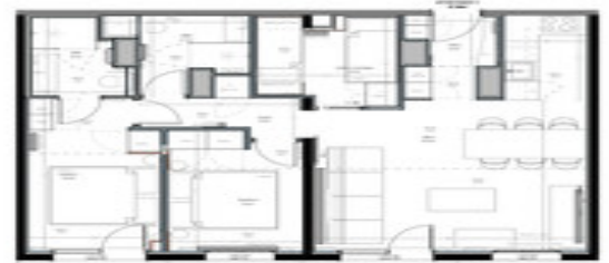
Appartement T3 + coin montagne 67.48m 2 R+2